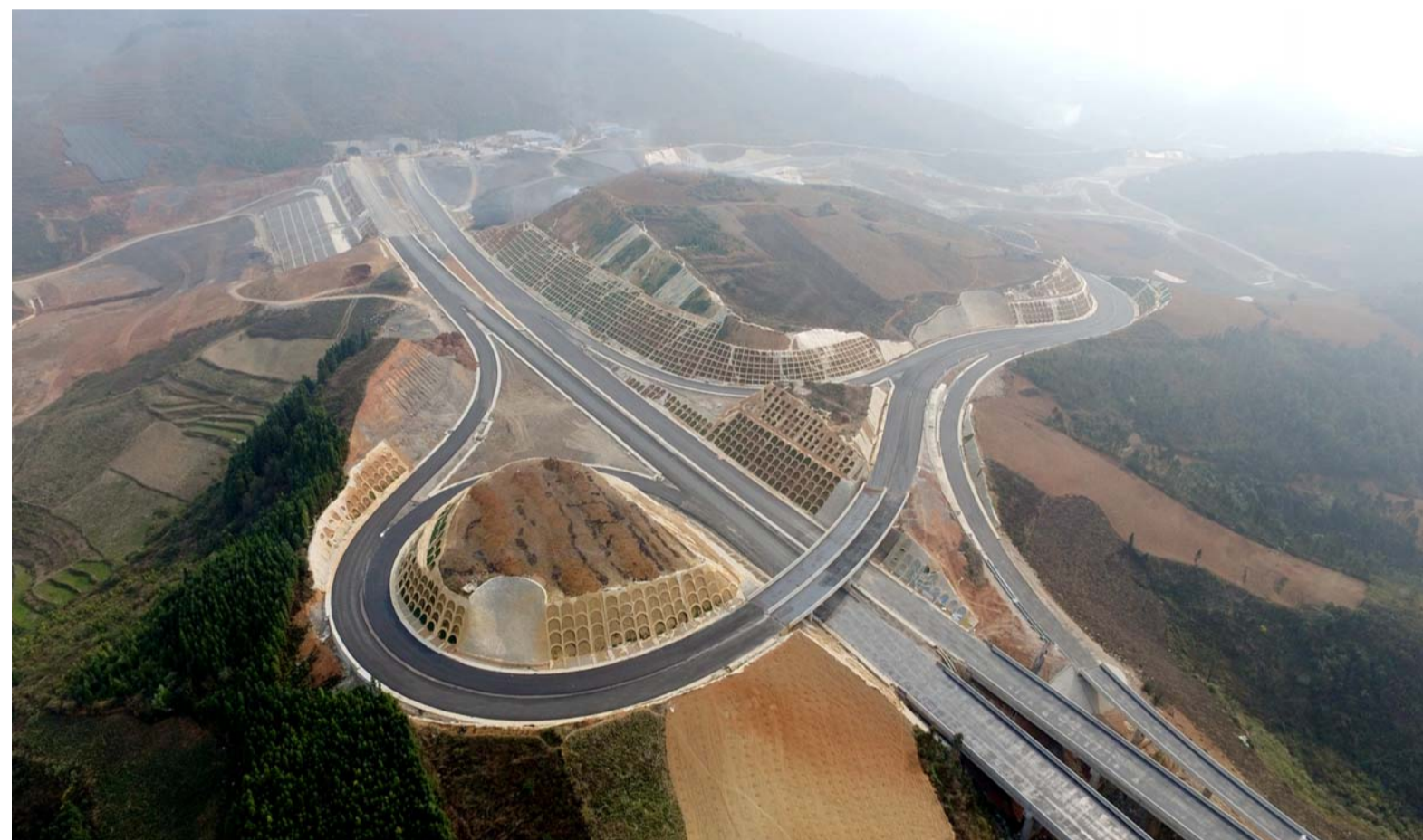
近日,四公司参建的蒙文砚高速公路工程芷村互通立交工程全部匝道桥完成交验工作,附属工程、沥青中面层全部完工,为全线通车打下坚实基础。