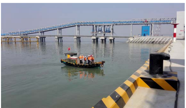
近日,五公司承建的国投涠洲湾煤炭码头装卸船泊位及二期一阶段工程首批交工项目顺利通过验收。

五工区两河站是青岛地铁首次应用清水混凝土的车站之一。此次观摩的五工区两个工点,向青岛地铁集团及其他线路参建方展示了中国交建以及一航局在青岛地铁市场的优秀形象,并对提升安全质量标准化工水平起到了有效的促进作用。